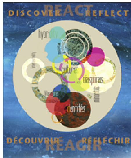
Table of contents / Table des matières